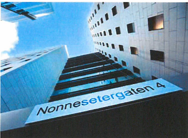
NONNEN: Nonnesetergaten 4, Bergen