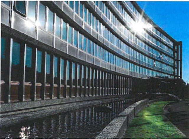
NVE-BYGGET: Middelthunsgate 29, Oslo