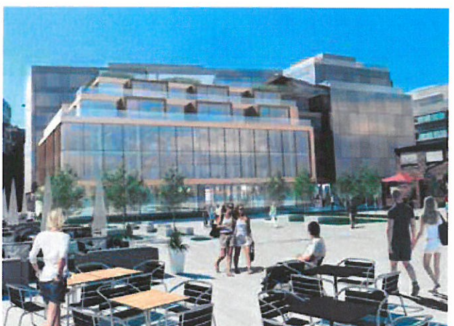
S16: Schweigaardsgate 16, Oslo