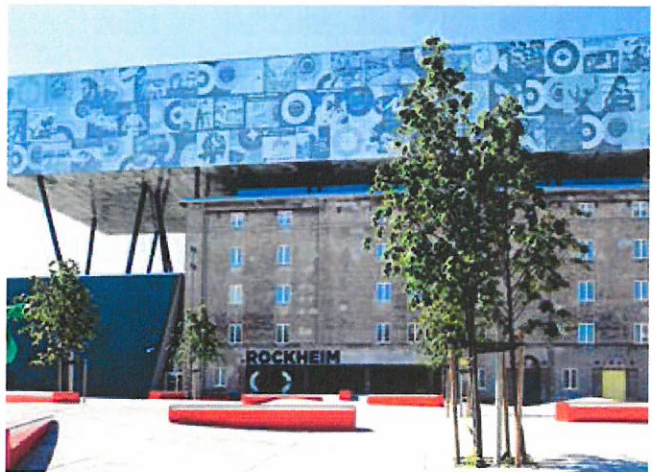
ROCKHEIM: Brattørkaia 14, Trondheim